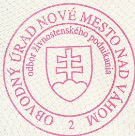
Mgr. Jarmila Schmidlová vedúca odboru

Osvedčenie o živnostenskom oprávnení je vydané podľa § 47 ods. 4 v spojení s § 10 ods. 4 a § 66b ods. 1 zákona č. 455/1991 Zb. o živnostenskom podnikaní (živnostenský zákon) v znení neskorších predpisov.